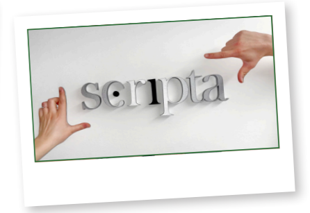
Scripta sc Progetto grafico e impaginazione